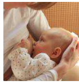
Quand allaiter rime avec carence en vitamine D Santé - 15h43 -