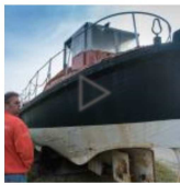
DIAPORAMA. Le sauvetage héroïque de l'Atlante a marqué Noirmoutier Noirmoutier-en-l'Île - 16h06