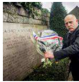
Manifestation interdite à Calais. Le procès de l'organisateur en mars Justice - 16h07